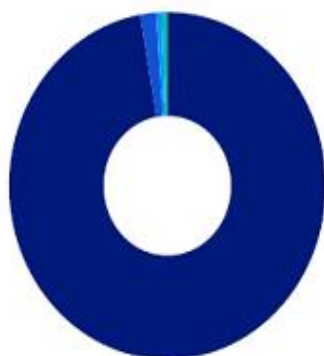
Geographic allocation (%)

Please see the website for complete holdings information. Holdings are subject to change.