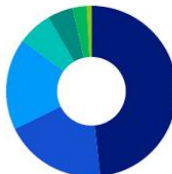
Sector allocation (%)