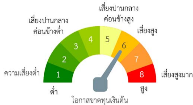
แผนภาพแสดงตำแหน่งความเสี่ยงของกองทุนรวม

- กองทุนอาจลงทุนหรือมีไว้ในสัญญาซื้อขายล่วงหน้า (Derivatives) เพื่อป้องกันความเสี่ยง (Hedging) จากอัตราแลกเปลี่ยนตามความเหมาะสมสำหรับสภาพการณ์ในแต่ละขณะ ขึ้นอยู่กับดุลยพินิจของผู้จัดการกองทุน เนื่องจากกองทุนไม่ได้ป้องกันความเสี่ยงอัตราแลกเปลี่ยนทั้งจำนวน ผู้ลงทุนอาจจะขาดทุนหรือได้รับกำไรจากอัตราแลกเปลี่ยนหรือได้รับเงินคืนต่ำกว่าเงินลงทุนเริ่มแรก